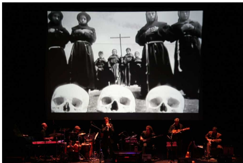
Still: Nine Rain performance, Mexico 2009

Om de Dag van de Doden te vieren op 1 November heeft Cinemaztlán de alternatieve Mexicaanse muziekgroep Nine Rain uitgenodigd. De groep componeerde speciaal voor de klassieke stille film van Sergei Einstein Que viva Mexico! een soundtrack. De band die afkomstig is uit Oaxaca, mixt traditionele Mexicaanse muziek met vrije experimentele muziek. De groep bestaat uit multi-instrumentale muzikanten – waaronder ook Steven Brown van de avant-garde band Tuxedomoon – die hun eigen instrumenten maken. Het evenement is een samenwerking tussen Cinemaztlán en Rocket Cinema festival in Paradiso.